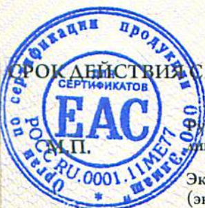
схема сертификации 1с

СРОК ДЕЙСТВИЯ 03.07.2013 ПО 03.07.2018 ВКЛЮЧИТЕЛЬНО